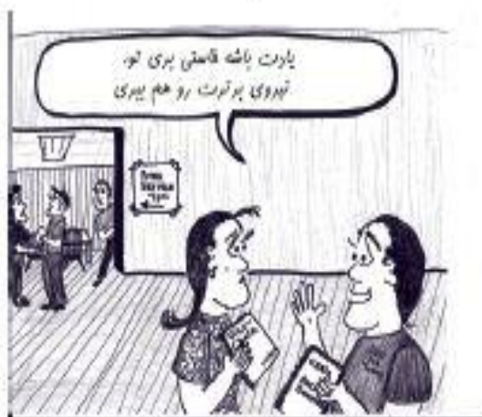
هنرمند نقاشی: پری. سی. هریش، آمریکا

از همه شما به خاطر مشارکت مسابقه شرح تصویر قدرانی می‌کنیم "عنوان" ارسال شده توسط "چاکدبی" از ایالت اورگان آمریکا، برنده مسابقه شماره قبلی مجله شد.